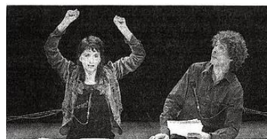
R. Senné / Bernard

délire. Un homme et une femme derrière une table jouent à nous raconter la pièce qu'ils ont écrite. Ils interprètent les quatre personnages, la mère, Josy, Marcel et un ami de Josy. Il est question d'un pique-nique, d'une colonie de fourmis, d'une partie de pêche, de petits riens qui mis bout à bout racontent la précarité, le besoin de solidarité, d'amitié. Peu importe l'histoire. Ici, les auteurs s'amuse à montrer l'envers de la création, comme le chasseur retourne une peau de lapin. C'est malin, cocasse, drôle. Les comédiens sont excellents, passant d'un personnage à l'autre, changeant d'accent, de physionomie, à