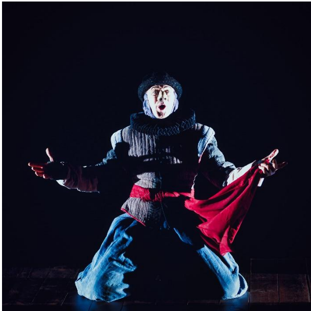
La Tragédie Comique

PRIX DU MEILLEUR SPECTACLE ETRANGER AU CARREFOUR INTERNATIONAL DE THEATRE DE QUEBEC (1992)